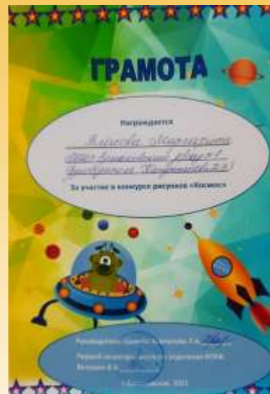
Конкурс рисунков «Космос»