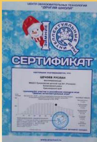
«Зимние интеллектуальные игры»