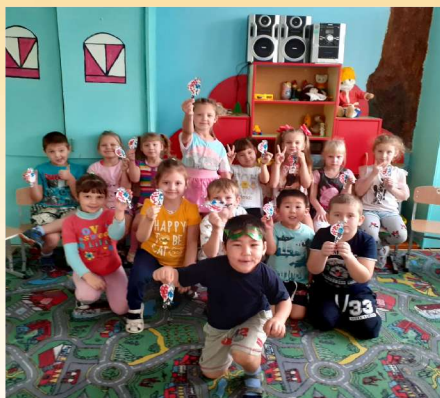
«Эколята – молодые защитники природы»