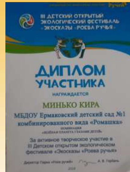
III Детский открытый экологический фестиваль «Экосказы «Роева ручья»